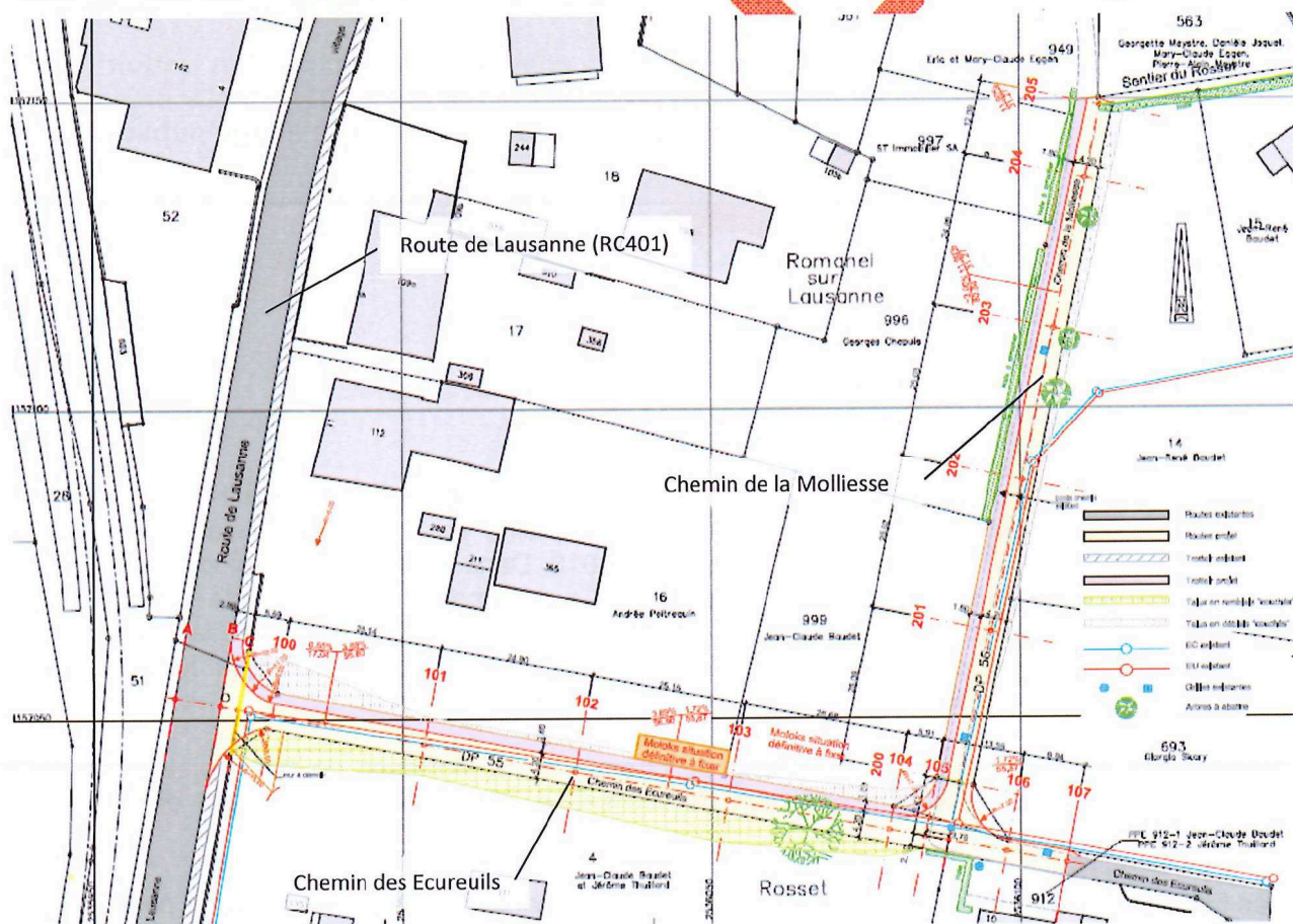
Plan de situation : Figure 1 Situation du projet

La figure 1 ci-dessous présente la situation des travaux et les zones d'intervention du projet mentionné dans ce préavis.