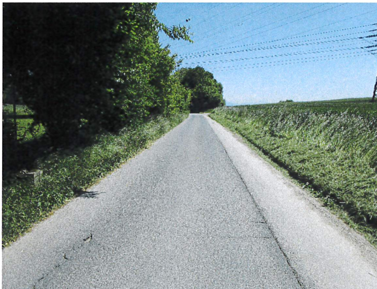
Figure 2 : Chemin du Marais à réfectionner

L'objectif de la présente étude est, d'une part, d'étudier la deuxième étape de la remise à ciel ouvert du ruisseau du Tord Cou, mais également de profiter des travaux pour réfectionner le chemin du Marais et remplacer les collecteurs existants situés sous ledit chemin.