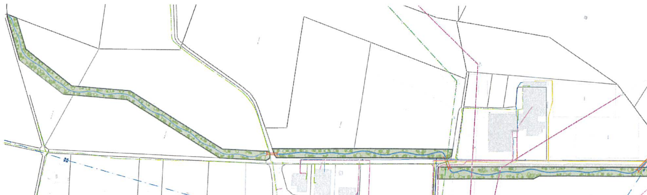
Figure 2 : Situation selon le pré-projet

L'objectif de la présente étude est de compléter celle faite dans le cadre de la deuxième étape. Le but final étant de réaliser un projet global comprenant les deux étapes de remise à ciel ouvert du ruisseau du Tord Cou mais également de profiter de ces travaux pour effectuer la réfection du chemin du Marais et de remplacer les collecteurs existants se trouvant sous cette partie de route.