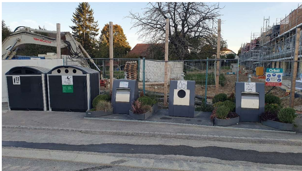
Figure 2 : Écopoint des Écureuil (avec équipement similaire à l'écopoint projeté)