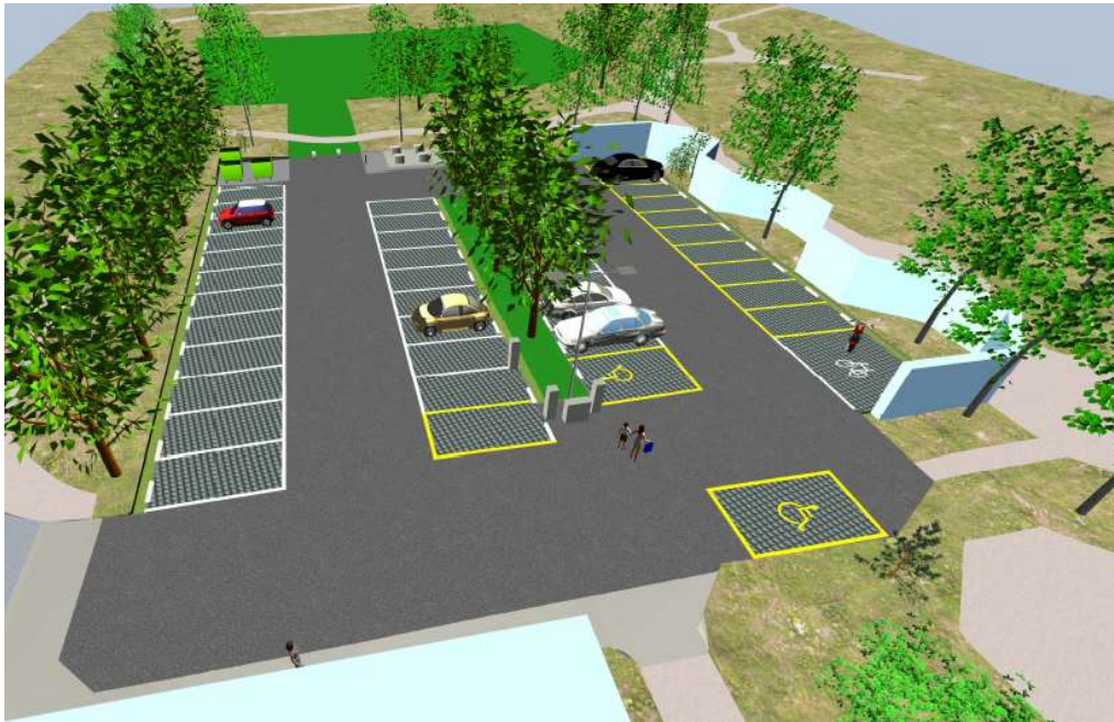
Figure 4 : Visualisation 3d depuis la Maison de commune