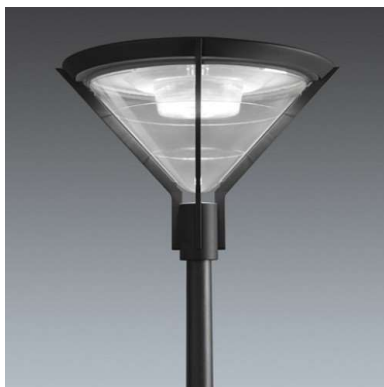
Luminaire Avenue F2

La fouille sera majoritairement effectuée dans la banquette herbeuse en bord de route afin de minimiser les coûts de réfection routière. Le tube sera prolongé jusqu'au bout de la rue, en réserve.