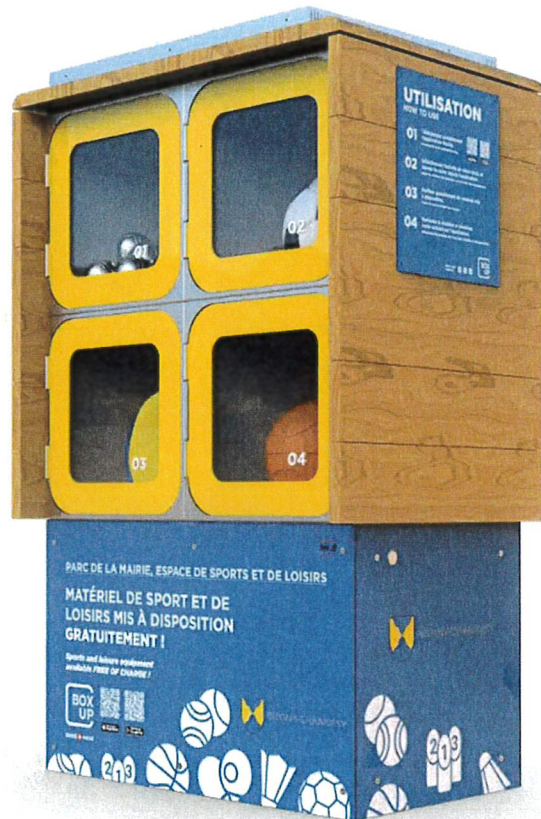
Exemple de station BoxUp 4 casiers

Aux Esserpys, il pourrait être intéressant d'envisager une installation plus grande proposant un jeu de pétanque, des ballons, des raquettes de badminton, des jeux familiaux (Mölkky ou Kubby), voire des accessoires de fitness.