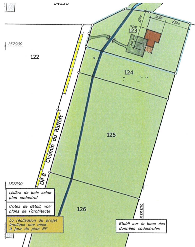
Plan de situation dressé en 2007

En janvier 2010, le propriétaire de la parcelle 126 informait la Municipalité de sa décision de faire don de son bien-fonds gratuitement à la commune dans le but d'y construire le futur refuge; la transaction a été conclue quelques années plus tard. C'est également à cette même période que la commune a reçu en don la parcelle 124 et a acquis la parcelle 125, complétant ainsi la totalité de la bande forestière qui longe la Pétause depuis la frontière communale jusqu'à Fontagny.