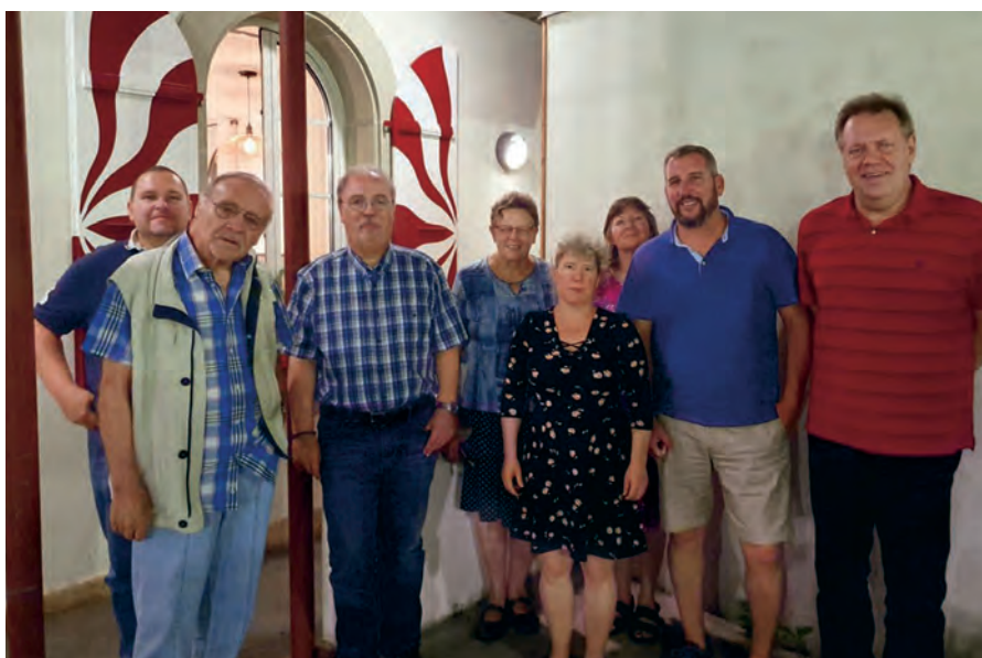
La passation des clés a eu lieu le jeudi 4 juillet.