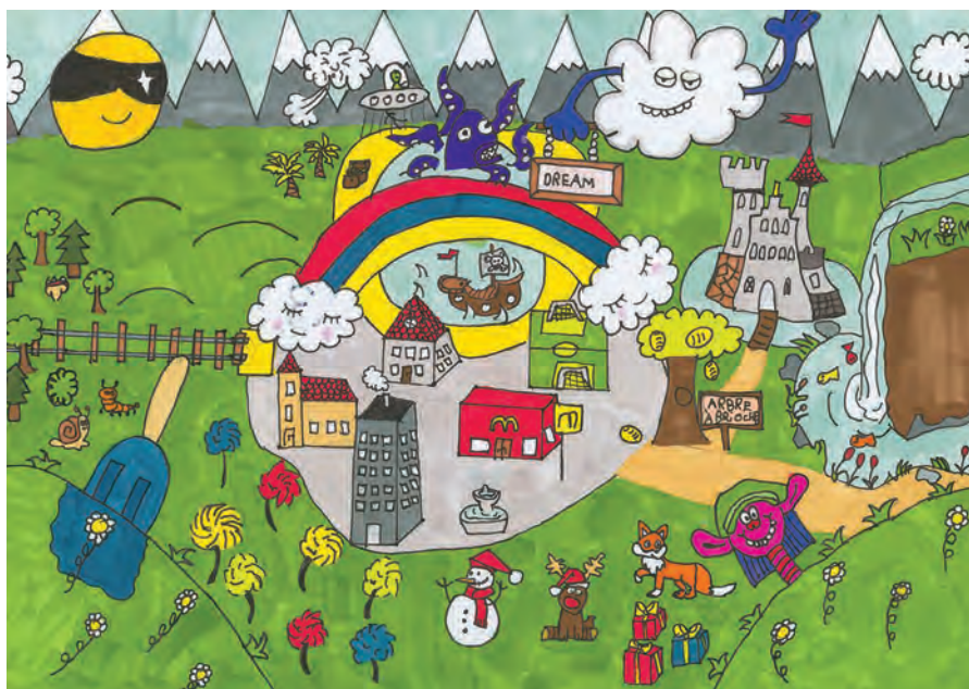
Dessin de Jérôme Chanez, classe 6P/PQ8