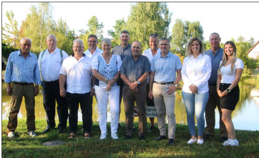
Le comité d'organisation

S'agissant d'une Fête romande, la télévision Suisse sera présente sur le site, ainsi que divers médias qui couvriront l'évènement.